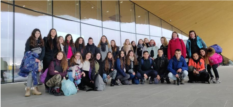
Espanja-projektilaiset Oodin edustalla huhtikuu 2019