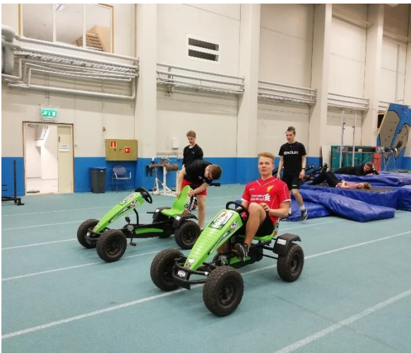
Valmennuskurssi Tanhuvaarassa toukokuu 2019

Edellisvuosien tapaan jatkoimme kurssiin liittyen yhteistyötä Tanhuvaaran urheiluopiston kanssa. Ideana on ollut tarjota kurssilaisillemme mahdollisuus seurata kehittymistään kaksi kertaa vuodessa toteutettavien kuntotestien avulla. Tanhuvaaran urheiluopisto on toteuttanut urheilijoille eri lajiryhmien virallisia liittopohjaisia kuntotestejä, ja liikunnan harrastajille yleisiä fyysisiä ominaisuuksia mittaavia testejä. Lähtötasotestit toteutettiin maanantaina 10.9.2018 Joutsan urheilukentällä ja liikuntahallilla. Näitä testejä seurasi noin 8 kuukautta kestänyt harjoittelujakso, jonka jälkeen matkustimme perinteiseen tyyliin seurantatesteihin Tanhuvaaran urheiluopistolle. Tuo testileiri toteutettiin 17.-18.5.2019.