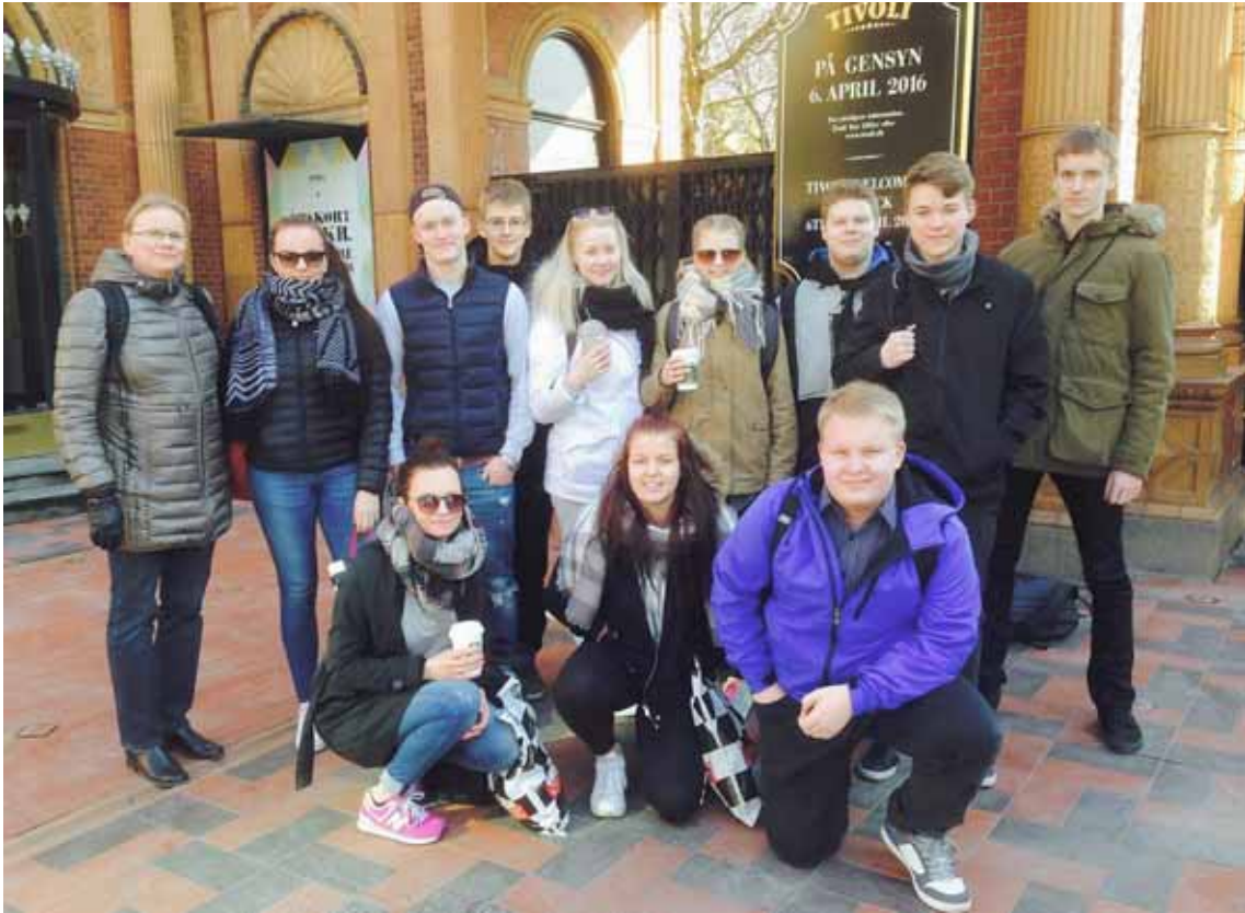
NZEB -projektilaiset Tanskassa 7. - 11.3.