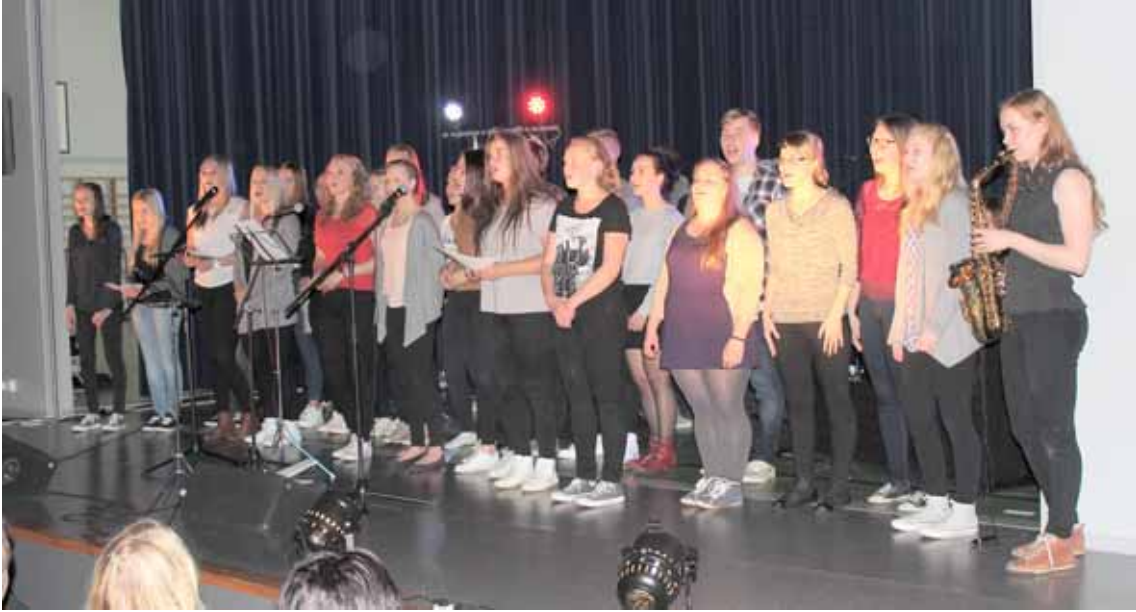
Kun tänään lähden -konsertti Ranskan matkaa varten