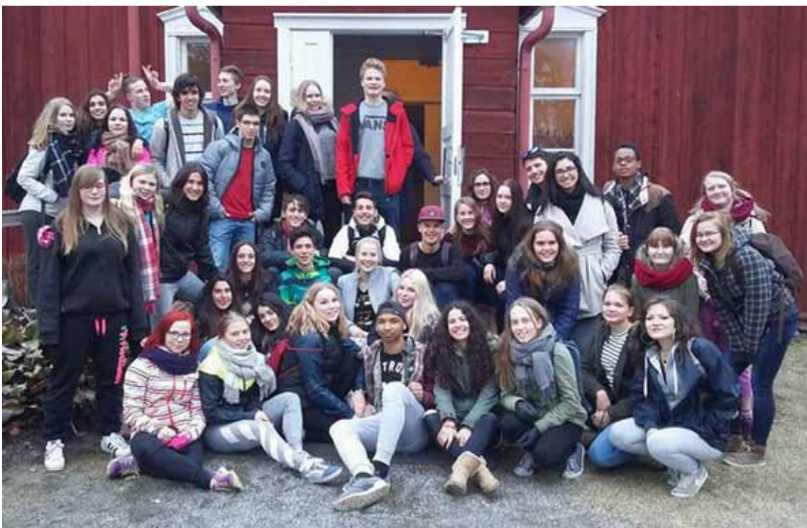
Horizon 2. työpaja Joutsassa 11. - 15.4.