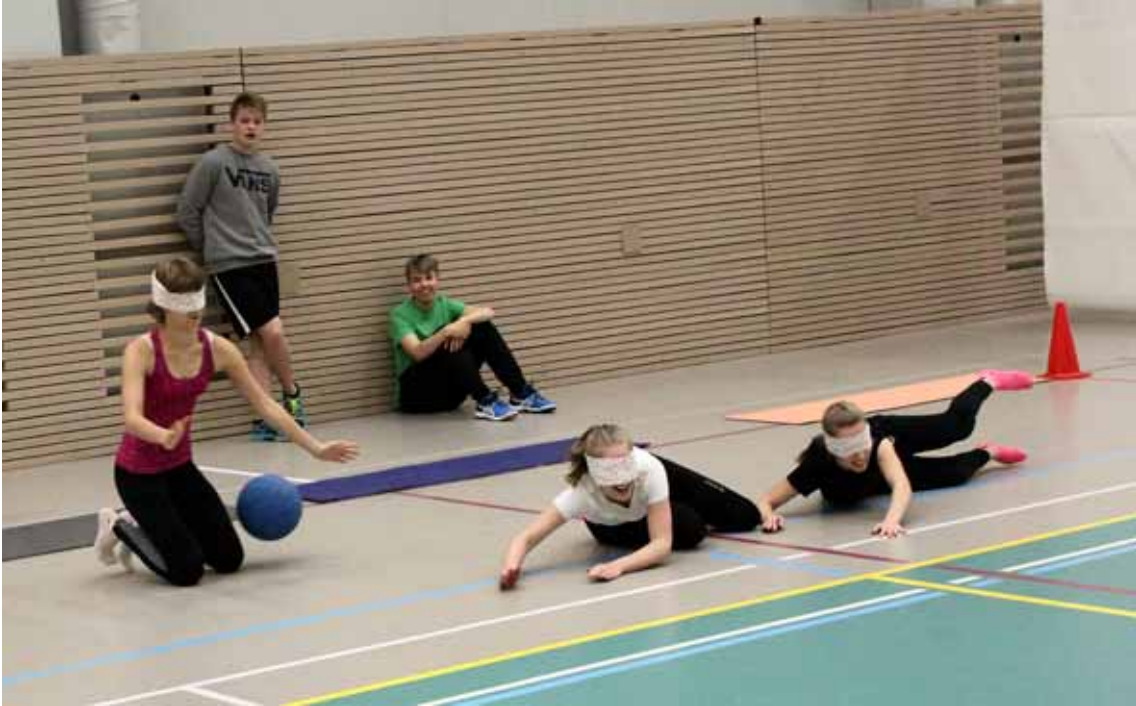
Maalipalloa näkövammaisille liikuntahallissa