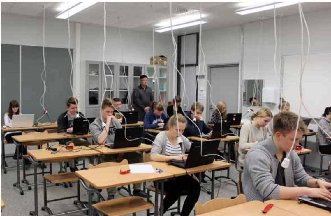
Tuleva sähköinen ylioppilaskirjoitus