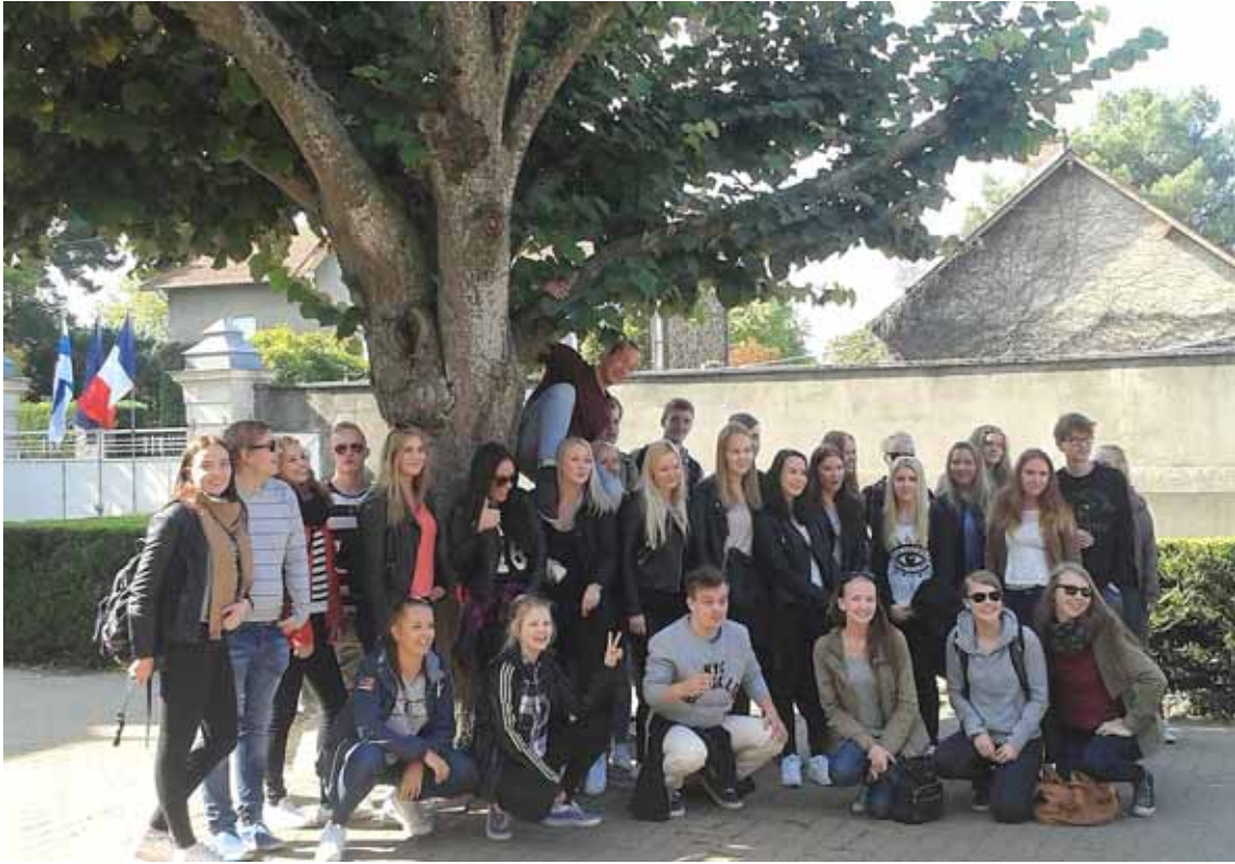
Ranska -projektillaiset La Pommerayen -vierailulla 1. - 8.10.