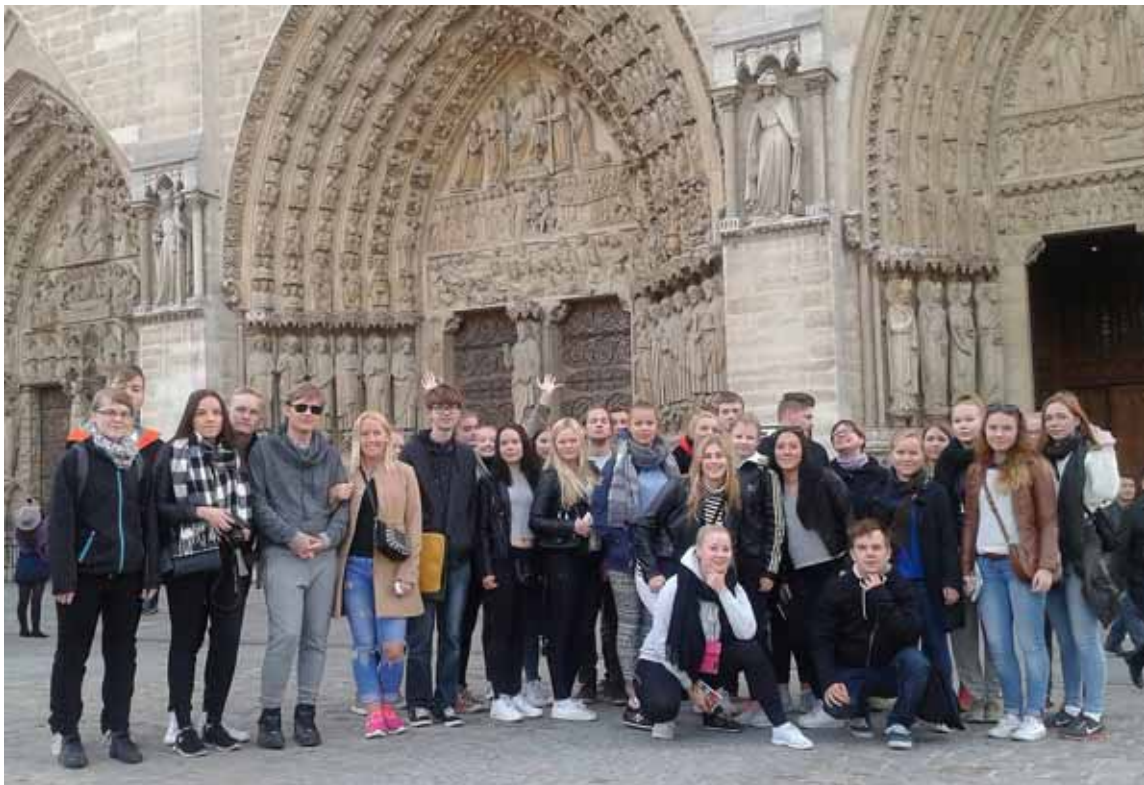
Pariisissa 8. -10.10. Kuva Notre Damen edestä.