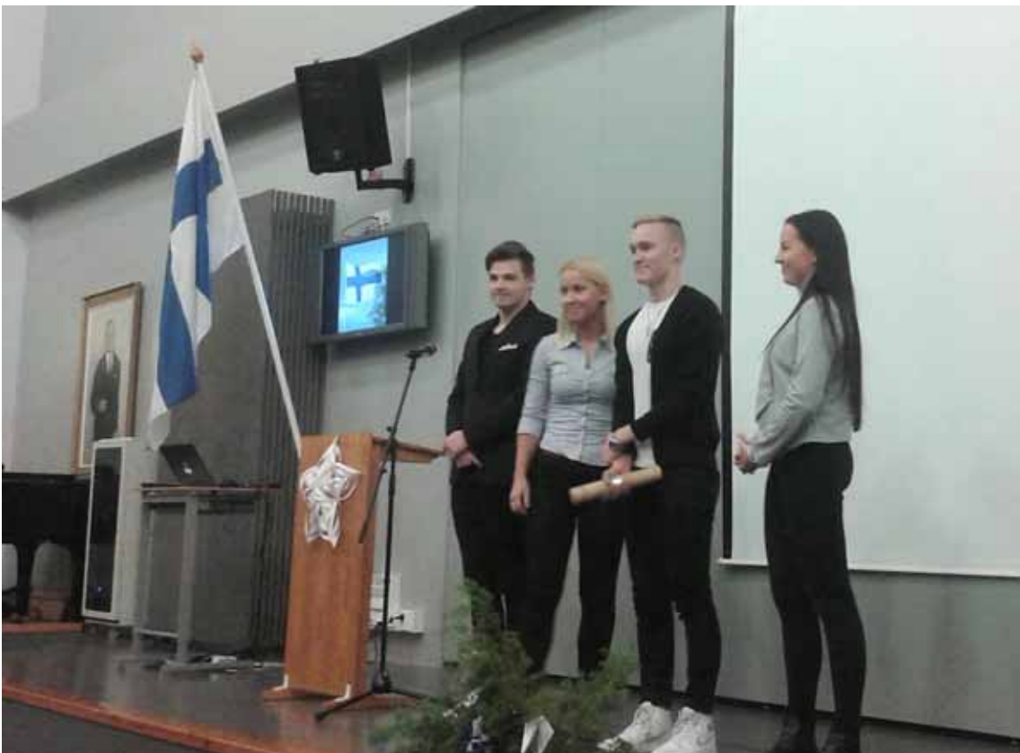
Vapauden viestin luovutus itsenäisyysjuhlassa