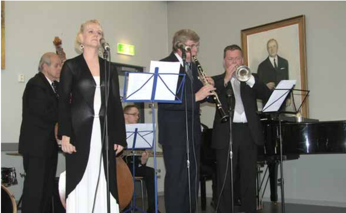
Joutsan yhteiskoulun 65- ja lukion 50- vuotisjuhla