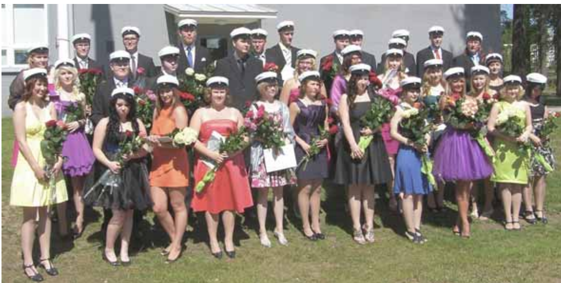
Kevään 2011 ylioppilaat