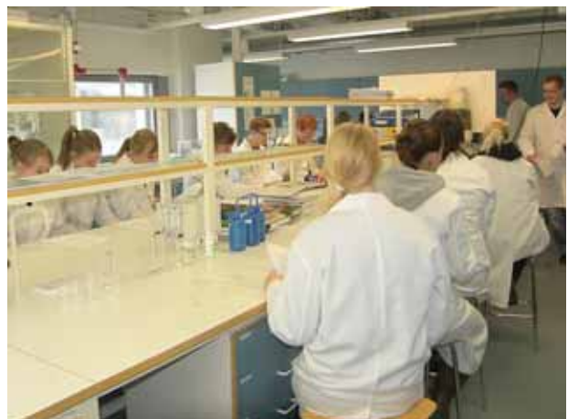
Jyväskylän yliopiston kemian laitos