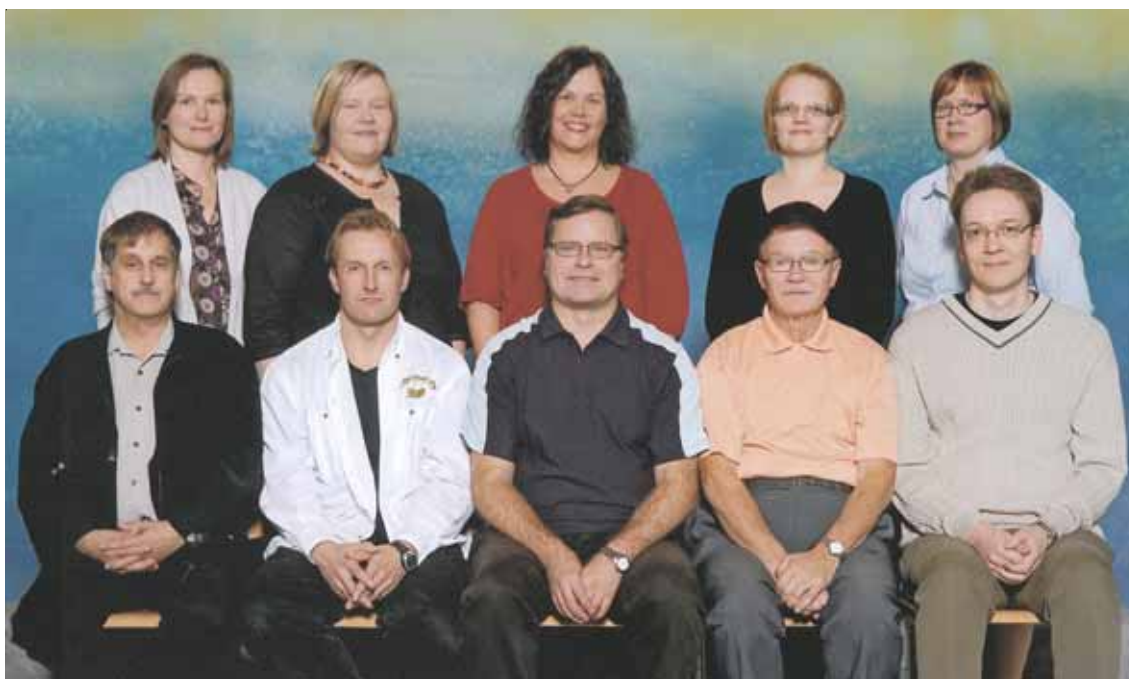
Opettajista valokuvauksessa läsnäolleet