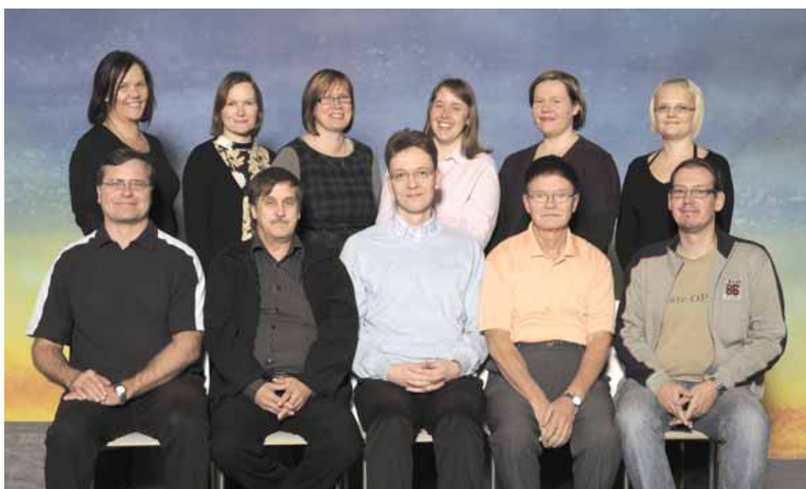
Opettajista valokuvauksessa läsnäolleet