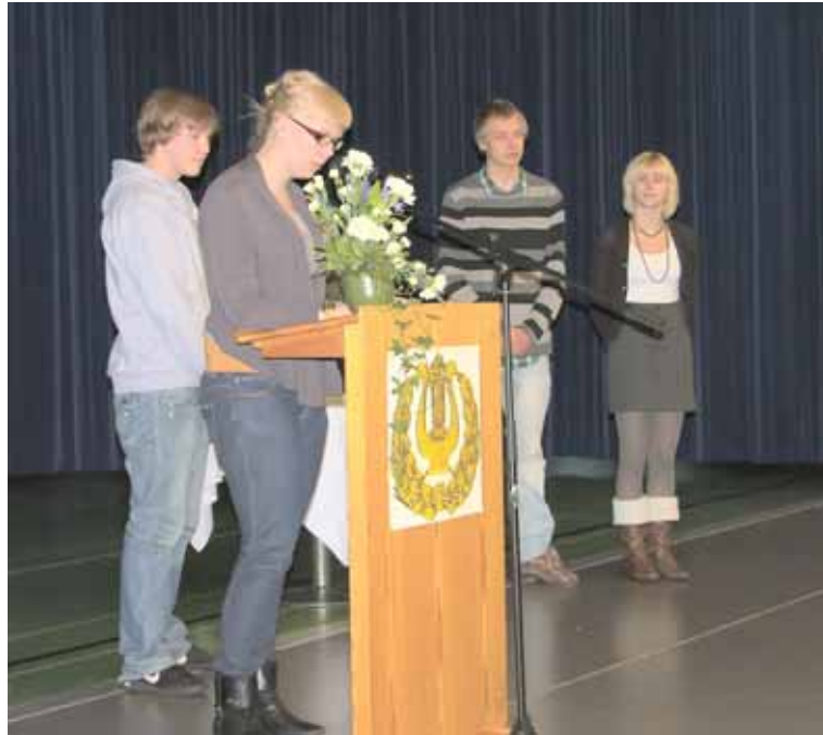
Vapauden viestin luovutus