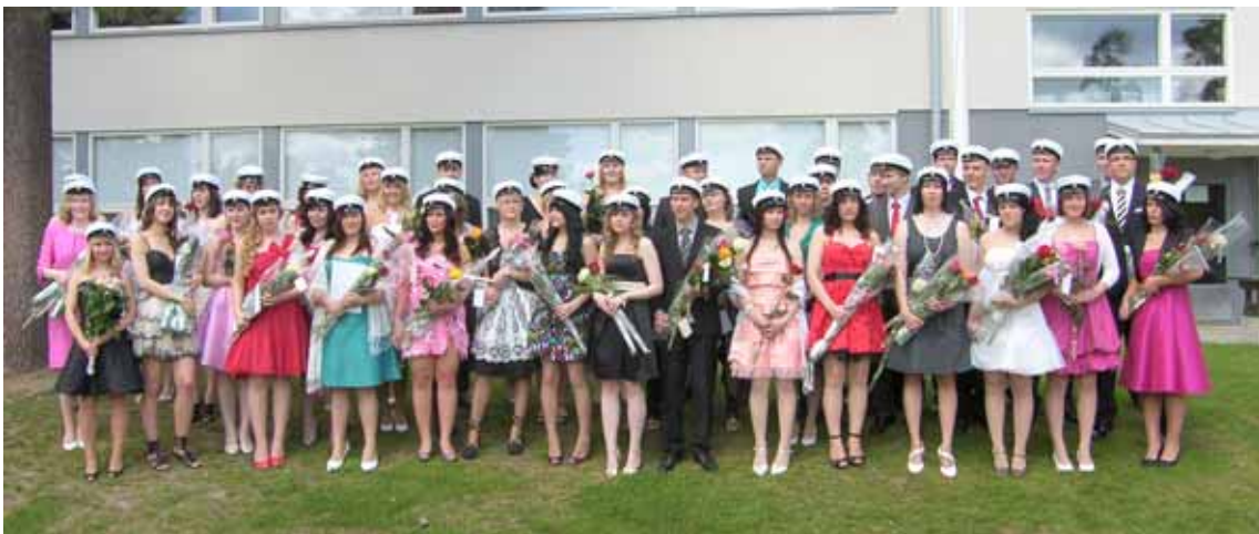
Kevään 2010 ylioppilaat