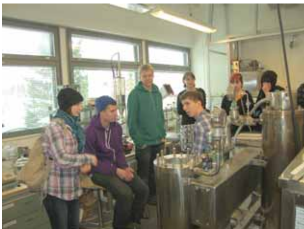
Jyväskylän yliopiston kemian laitos