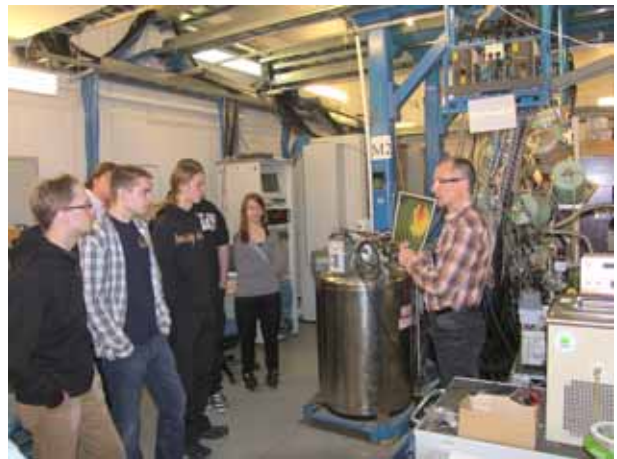
Jyväskylän yliopiston fysiikan laitos