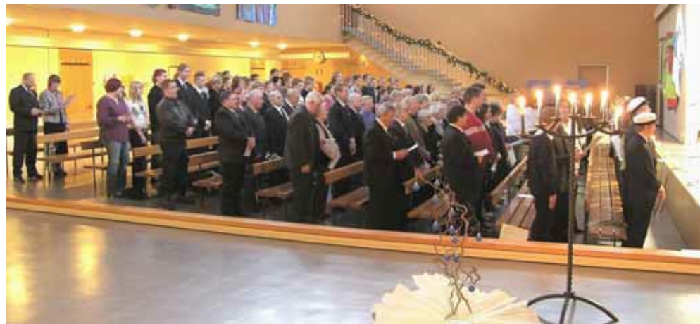
Itsenäisyys- ja lakkiaisjuhla