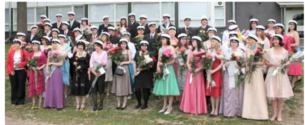
Kevään 2005 ylioppilaat